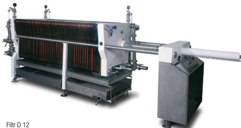
Filtr D 12

Dle vybrané velikosti filtru vám dodáme i nerezové čerpadlo o potřebném výkonu. Filtrační desky jsou vyrobeny ze speciálních druhů vysoce jakostních celulózových vláken, křemelin a perlitů, které vytvářejí trojrozměrný hloubkový filtr s velkým vnitřním povrchem. Pro filtraci potravinářského oleje se používají filtrační plachetky. Filtrační plachetky jsou vyrobeny z polypropylenové tkaniny, která je pro tento účel filtrace speciálně upravena.