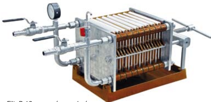
Filtr D 18 nerezové provedení

Dle vybrané velikosti filtru vám dodáme i nerezové čerpadlo o potřebném výkonu. Filtrační desky jsou vyrobeny ze speciálních druhů vysoce jakostních celulózových vláken, křemelin a perlitů, které vytvářejí trojrozměrný hloubkový filtr s velkým vnitřním povrchem. Pro filtraci potravinářského oleje se používají filtrační plachetky. Filtrační plachetky jsou vyrobeny z polypropylenové tkaniny, která je pro tento účel filtrace speciálně upravena.