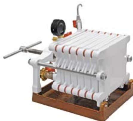
Filtr D 18 kovové provedení

České filtry s vysokou spolehlivostí a výkonem vyrábíme už přes 20 let. Po celou dobu držíme výhodnou cenu filtrů a jejich vysokou spolehlivost i výkonnost.