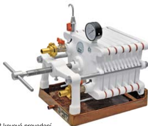
Filtr D 18 kovové provedení